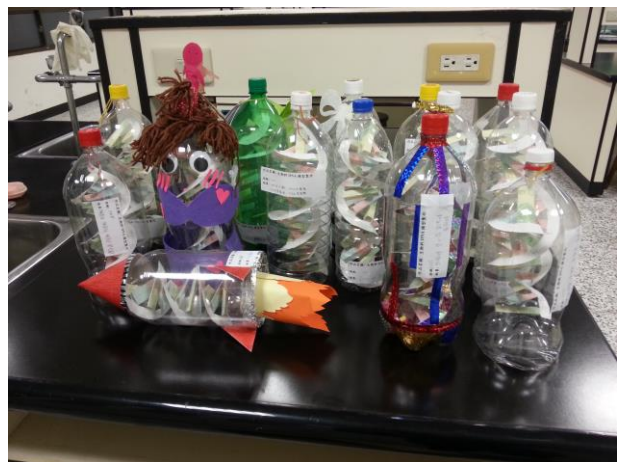
自然科模型化教學—紙做 DNA 模型學生作品