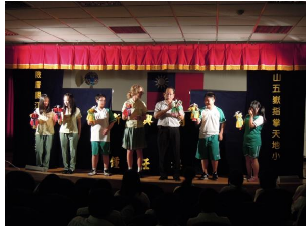
新興閣掌中戲偶表演體驗