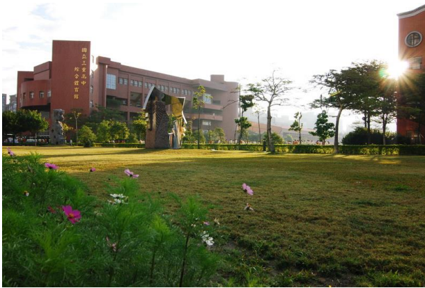
體育館及校園前草坪