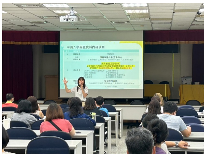
家長專注聆聽演講