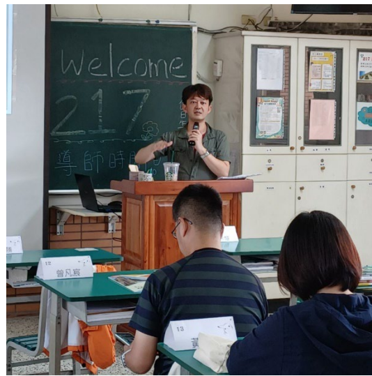
班級導師與家長互動時間