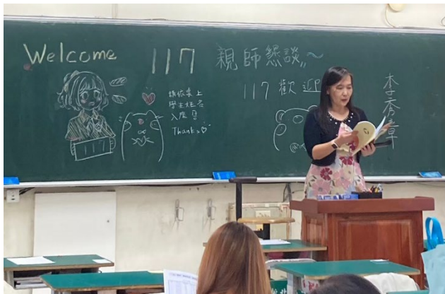
班級導師與家長互動時間