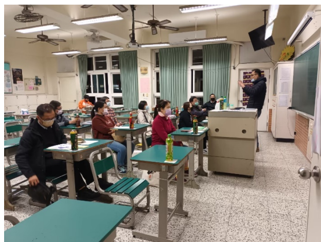
班級導師與家長互動時間