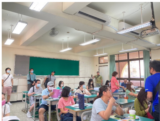
班級導師與家長互動時間