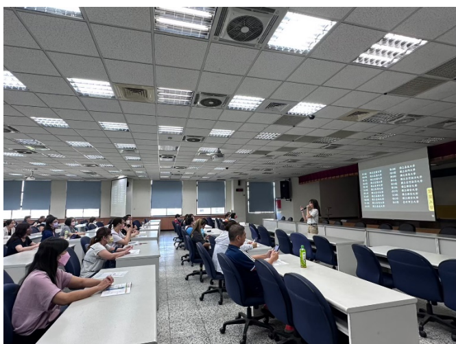
家長專注聆聽演講