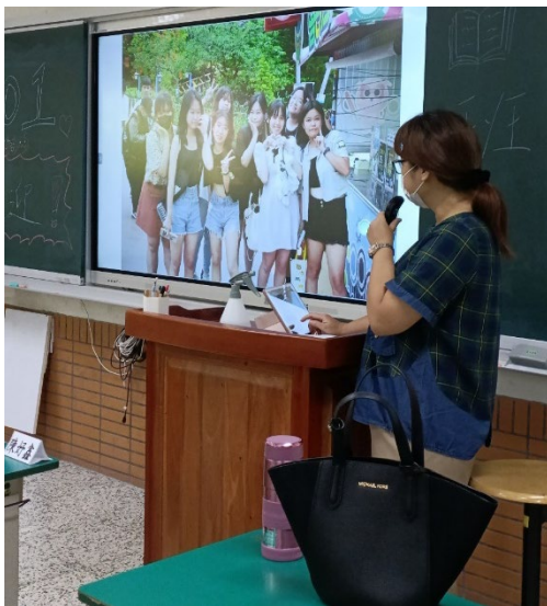
班級導師與家長互動時間