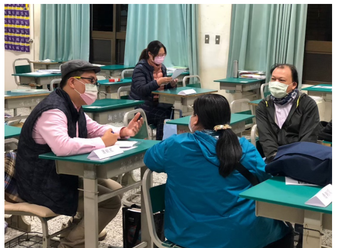
班級導師與家長互動時間