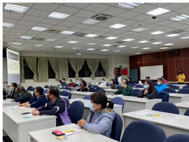
家長專注認真聽講。