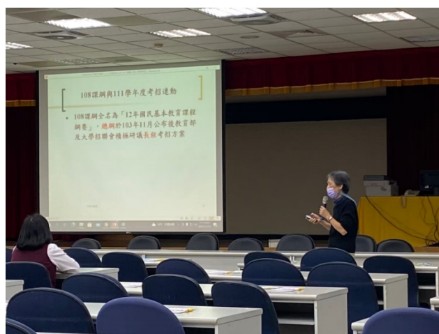
講師介紹說明 108 課綱對管道的變動。