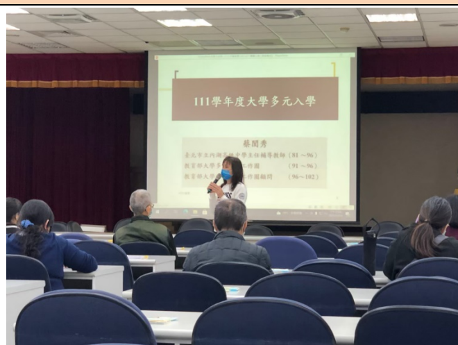
校長進行開場~說明不同管道的認識與重要性。