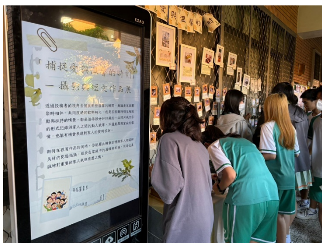
徵稿照片與短文作品於團體輔導室外展示。