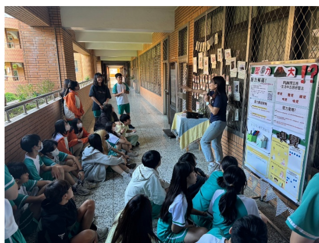
老師介紹攝影短文徵稿活動之宗旨，同學認真聆聽。