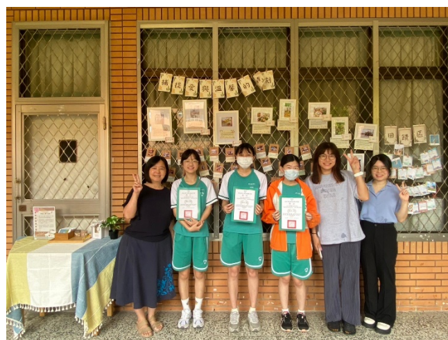
輔導主任、活動負責人與得獎同學進行合影。