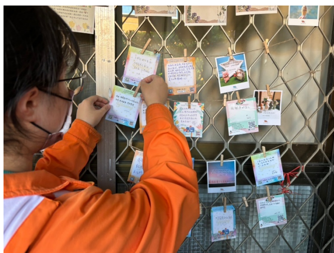
同學在回餽互動區寫下觀展心得。