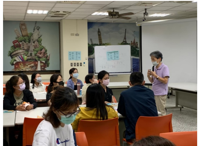
家長與講師互動良好。