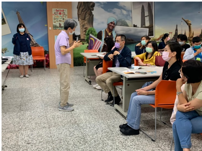
家長提問, 釐清升學上的疑惑。