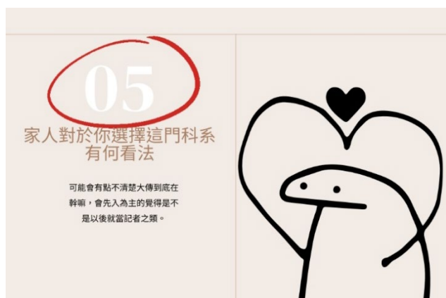
訪談對象談關於家裡對科系選擇看法見解